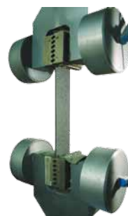
Laboratorní test pevnosti v tahu