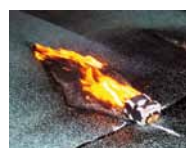
Laboratorní test odolnosti proti ohni

Díky speciální úpravě spřažené vložky dosahuje SK Bit 1-Plus vysoké požární bezpečnosti.