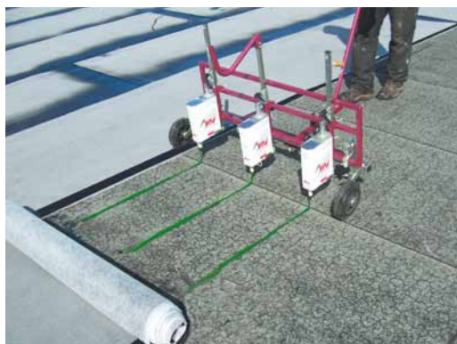
Lepení lepidlem PUK pro lepení střešních pásů

Při lepení lepidlem PUK za pomoci PUK-Koboldu se nanese na podklad (tepelná izolace, stávající hydroizolace atp.) na 1 m šířky tři nebo čtyři pruhy lepidla PUK min Ø 8 mm a neprodleně se položí izolační pás. Proužek lepidla se roztlačí, čímž je zajištěno optimální přilepení. Spoje a přesahy se vodotěsně svaří hořákem na spoje.